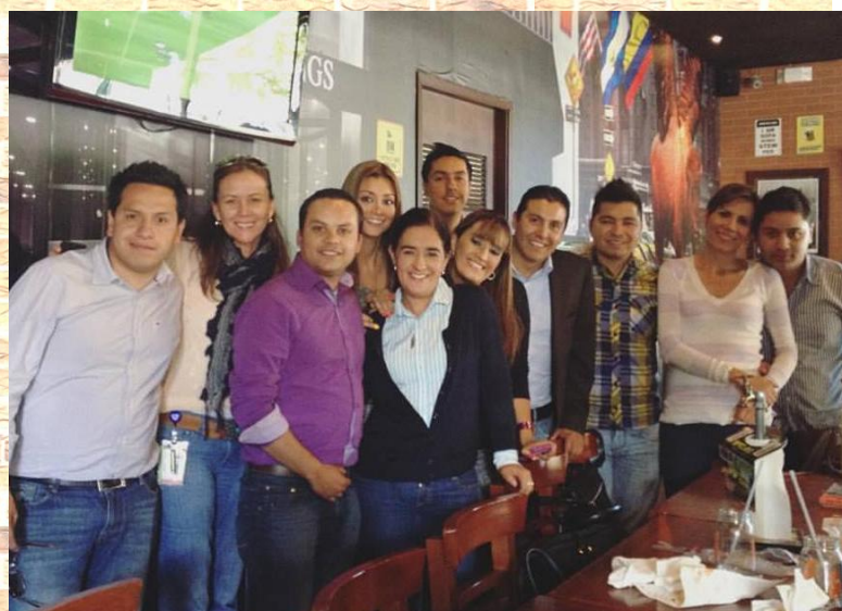
IMAGEN PARA EL RECUERDO DEL PERIODISMO