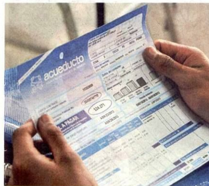
Los recibos empezaron a ser entregados desde esta semana en diferentes localidades.