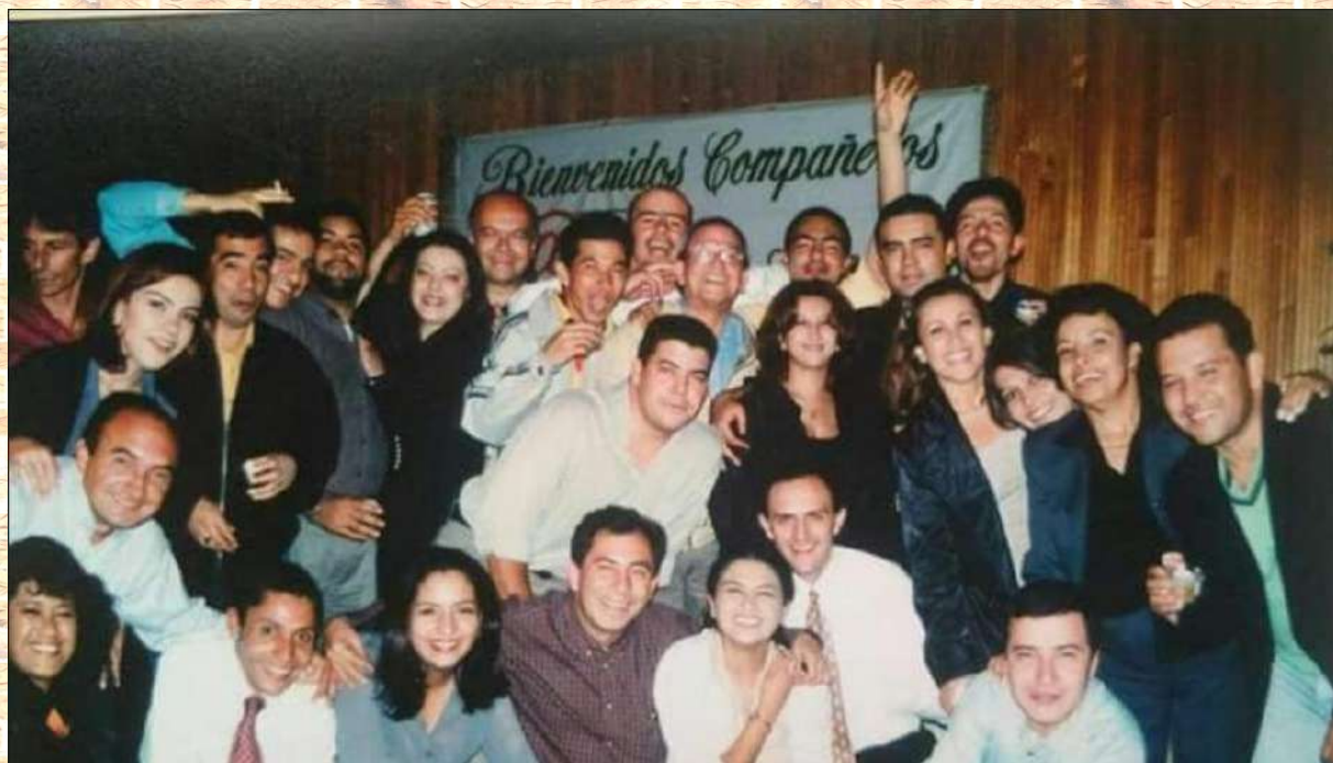
Felices 21 años Radionet