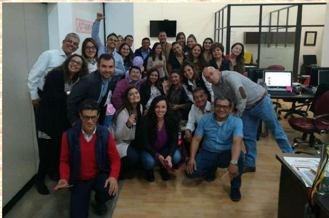
Equipo de Noticias Uno La Red Independiente