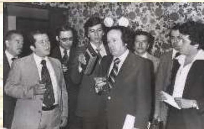
Pantalla & Dial).